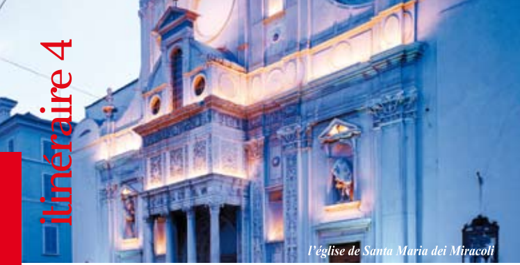
L'église de Santa Maria dei Miracoli