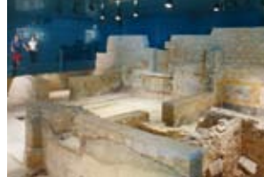
3 - Santa Giulia: la Domus dell'Ortaglia