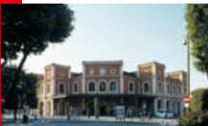
1 - La Gare

La gare, piazzale della Repubblica, corso Martiri della Libertà, via Moretto, contrada del Cavalletto, piazza del Mercato, piazza della Vittoria, piazza della Loggia (Office du Tourisme au n°13/b), piazza Paolo VI, via Giuseppe Mazzini, corso Giuseppe Zanardelli.