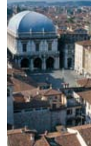
3 - Les Monti di Pietà

Le Palazzo della Loggia (4) . Erigé en remplacement d'une précédente loggia, sa construction débuta solennellement en 1492 et se poursuivit jusqu'en 1570 environ sous la direction de nombreux architectes. Elle présente à l'étage inférieur un vaste portique divisé en neuf travées reposant sur des colonnes avec des voûtes d'arêtes, et auquel on peut accéder par trois côtés à travers trois grandes arcades. En traversant un majestueux portail, flanqué de deux petites fontaines abritées dans les niches latérales, on accède à l'intérieur de cet édifice qui est le siège des institutions municipales. Le toit en carène de navire, qui remplace celui construit "ad attico", fut reconstruit sur le modèle de l'original détruit par l'incendie qui ravagea l'intérieur du palais en 1575. Un escalier monumental du XIXème siècle conduit à l'étage supérieur, occupé dans sa plus grande partie par le "salone vanvitelliano" du nom de l'architecte qui le conçut en 1773, Luigi Vanvitelli. A droite du Palazzo della Loggia se trouve l'ancien escalier d'honneur qui permettait d'accéder au premier étage: le palais Notarial relié à l'ensemble par un arc orné de statues de Jacopo Medici du 1565.