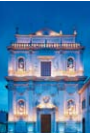
6 - Palazzo Beretta

À la fin de la via Magenta, dans le piazzale Arnaldo , se trouve l' église de Sant'Alfara in Sant'Eufemia (8) à l'admirable façade en marbre construite en 1776 sur les fondations d'un édifice de 1462 dont il reste encore le chœur et la crypte.