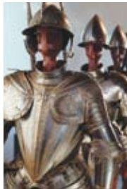
2 - Museo delle Armi

Le Mastio des Visconti abrite le Musée des Armes "Luigi Marzoli" , un des plus importants d'Europe pour la richesse de ses collections. En descendant du château vers la place Arnaldo (8), on arrive à l' église de San Pietro in Oliveto (17) . À côté, à l'intérieur du couvent des Carmélites Déchaussées, on peut visiter le cloître et la sacristie. Près de l'église, dans la via del Castello , se trouvent les ruines romaines de la Porte de Sant'Eusebio .