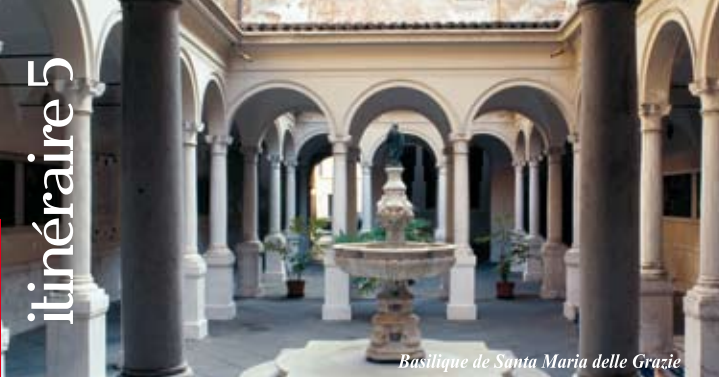
Basilique de Santa Maria delle Grazie