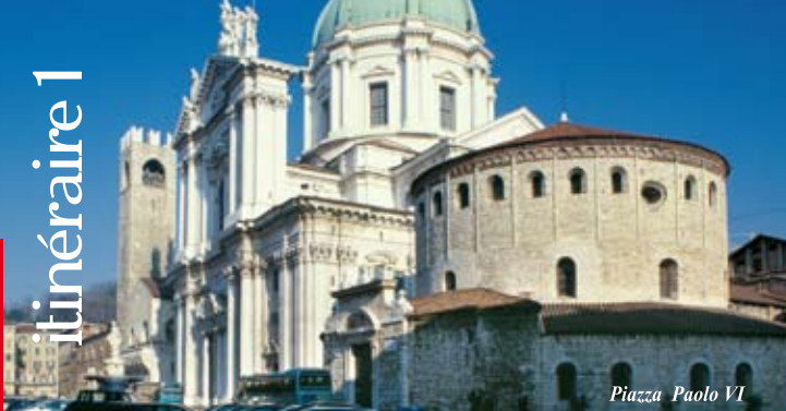
Piazza Paolo VI