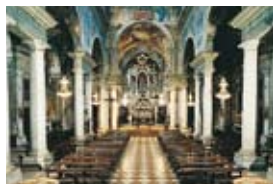
1 - Église de San Giuseppe. 2 - Église de San Faustino

1 contrada Santa Chiara (26) où se trouve l'ex monastère de Santa Chiara . L'escalier théâtral en marbre du XVIII ème est signalé. Au n°43, le Théâtre S. Chiara : une église du XVII ème transformée en salle de théâtre. Dans la via della Rocca , on longe le cloître de San Faustino , un ancien couvent bénédictin qui abrite l'Université de Brescia. La rue se termine sur le piazzale Cesare Battisti où se trouvait la porte de la ville dite Porte Pile ; on s'engage ensuite dans la via San Faustino: en descendant la rue, on notera sur la gauche, la